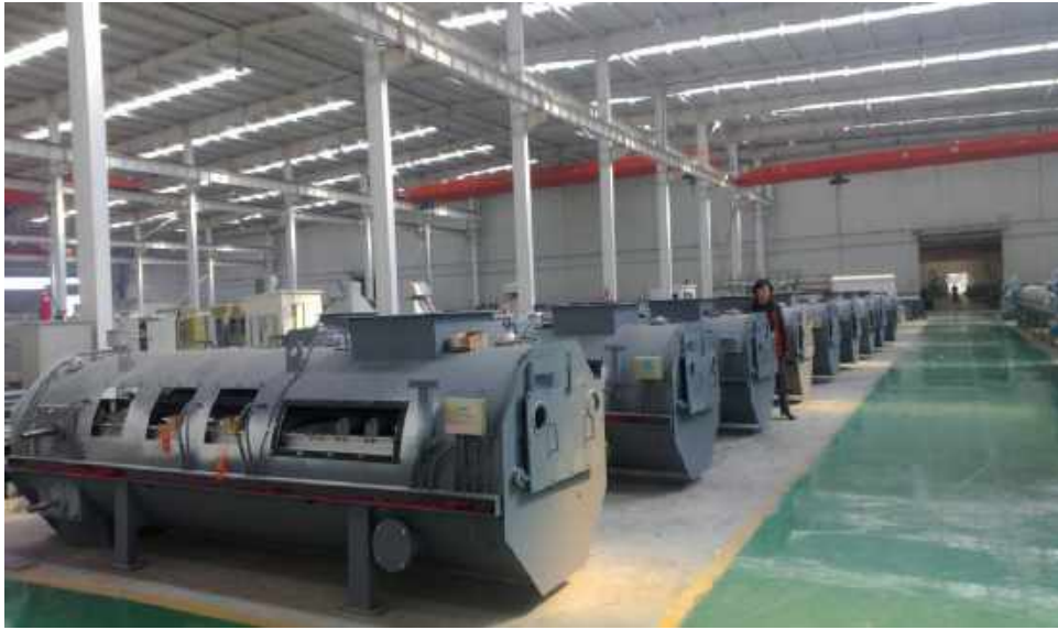
赛摩电气股份有限公司称重给煤机防腐 Weighing coal feeder anticorrosion of Saimo Electrical Shares Co., Ltd