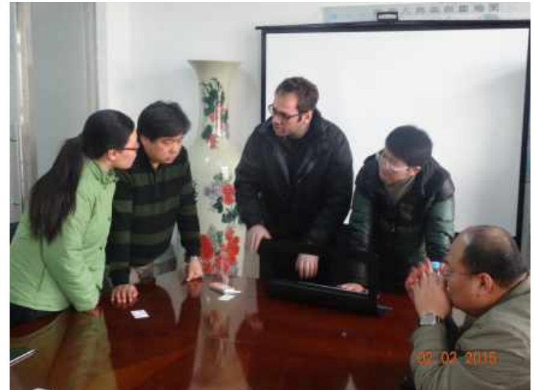
英国客户考察 British customers inspection