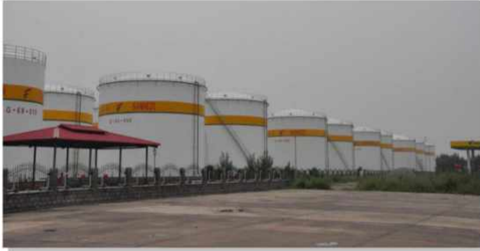
天津静海三合众成油罐外壁防腐 Oil tank exterior anticorrosion of Tianjin Jinghai Sanhezhongcheng Co., Ltd

天津 100 万吨 / 年 乙烯、1000 万吨 / 年 炼油 项目 储 罐 防 腐 Tianjin 1 million tons / year of ethylene, 10 million tons / year of refinery tank anticorrosion used our anticorrosive paint