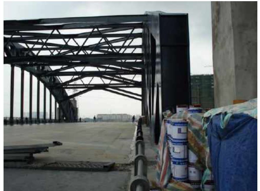
苏州悉尼大桥钢结构防腐 Steel structure anticorrosion of Xini Bridge in Suzhou