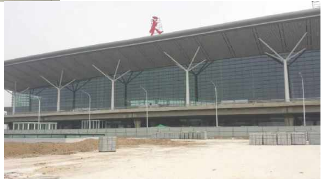
天津机场航站楼钢结构防腐 Anticorrosion of steel structure in Tianjin Airport Air Station

Anticorrosion of steel structure in Zhongjian steel structure manufacturing base tianjin plant