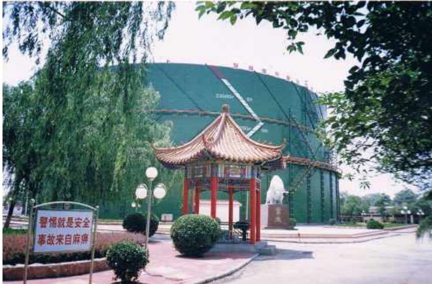
山东济钢燃气厂10万立方干式煤气柜防腐 100,000 cubic dry coal gas cabinet anticorrosion from Shandong Jinan Iron and Steel Gas Plant