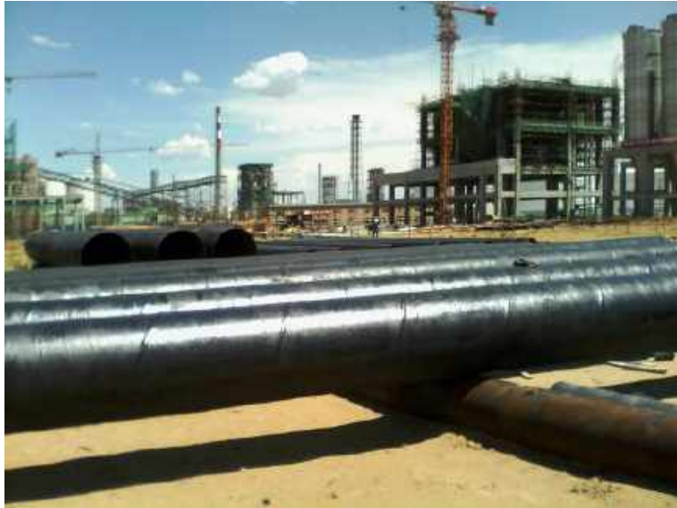
内蒙古久泰能源二期管道防腐 Pipeine anticorrosion of Long tai energy in Inner Mongolia

河北宝隆钢管制造有限公司五布七油 800微米防腐 Hebei Baolong Steel Pipe Manufacturing Co., Ltd. Five Steps Seven Oils 800 Micrometers Anti-corrosion