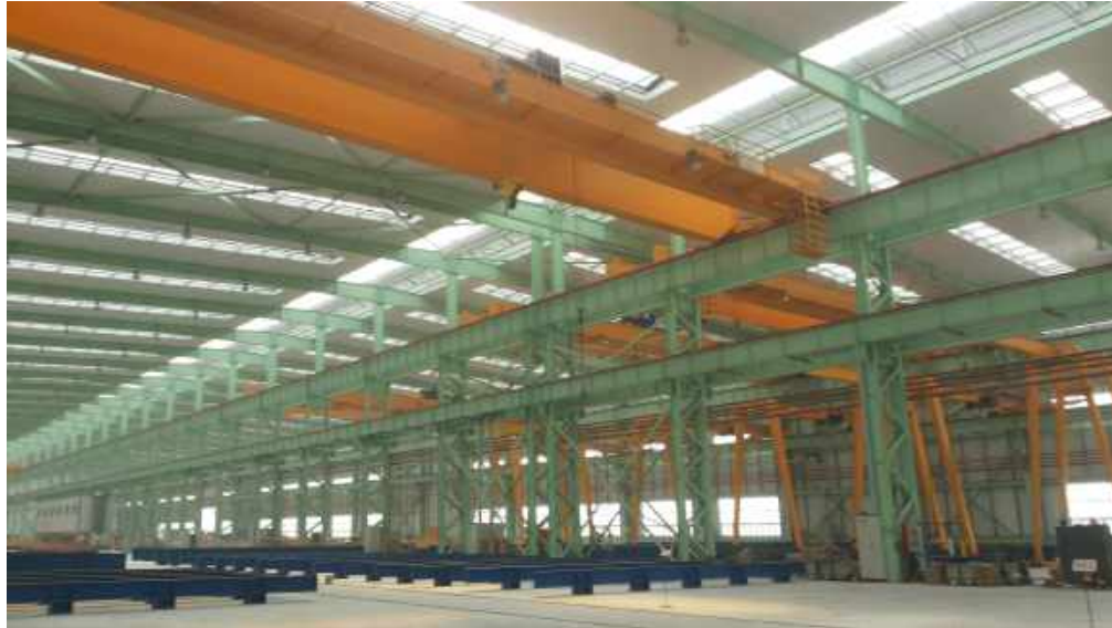
中建钢构天津钢结构制造基地 厂房防腐

Anticorrosion of steel structure in Zhongjian steel structure manufacturing base tianjin plant