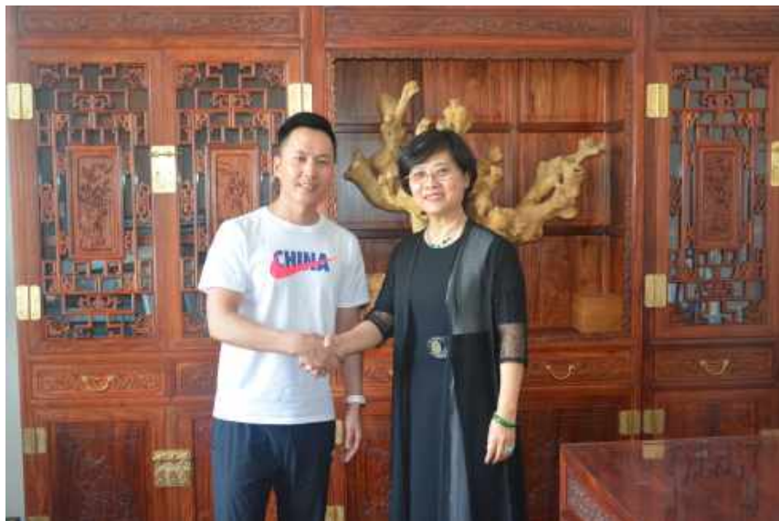
蒙古国客户考察 Mongolia Customer Visiting