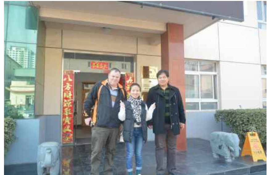
澳大利亚客户考察 Australian customers visit our company