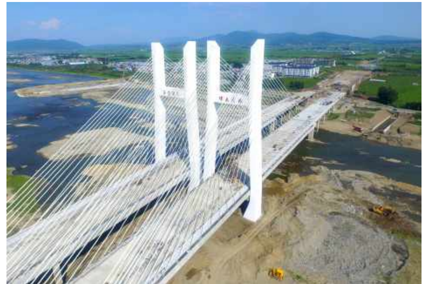
琿春大桥 11000 平米混凝土防腐 防水工程