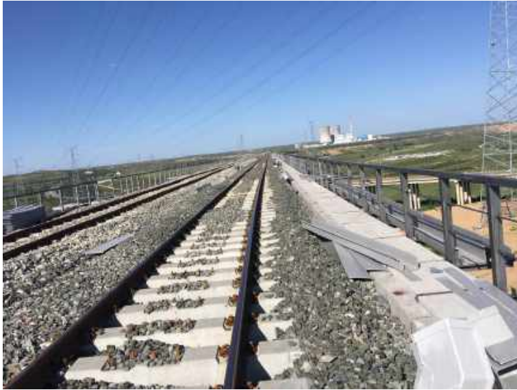
呼准鄂铁路护栏防腐 HUZHUNE RAILWAY PROTECTIVE BARS ANTICORROSIVE PROJECT