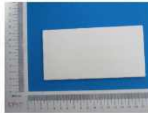
Photo of the Submitted Sample

Test Report No. C18101804002 Date: Oct 22, 2018 Page 2 of 3