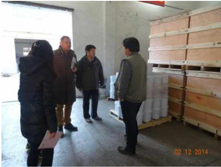
澳大利亚客户考察 Australian customers visit our company