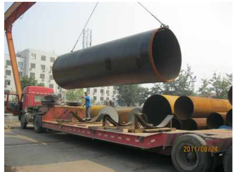
北京广渠路给水工程管道外壁防腐 Beijing Guangqu Road Water Supply Project Pipeline External Wall Anticorrosion