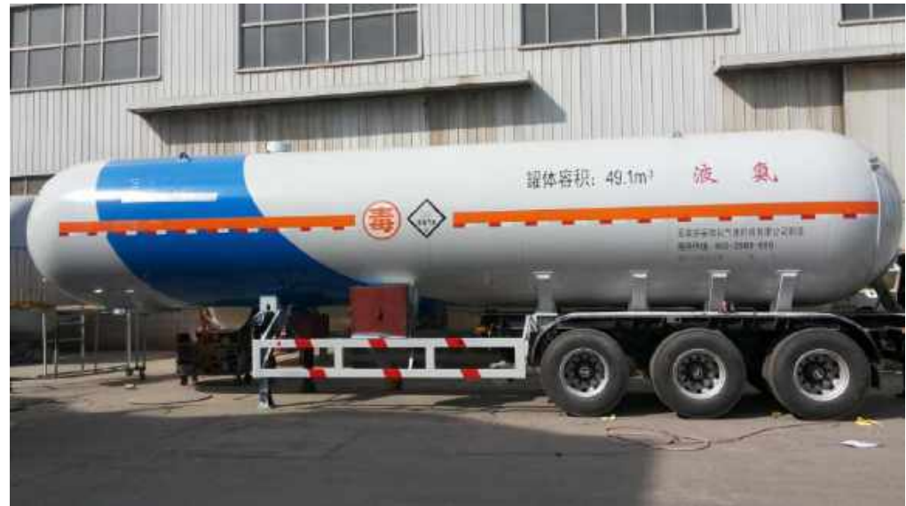
河北石家庄安瑞科液氨、丁二烯特种罐车防腐 Anticorrosion of Special tank car made by Hebei Anruike Co., Ltd