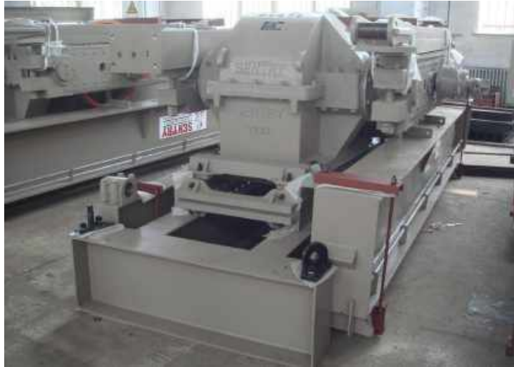
盘锦辽河油田凯特石油设备有限公司出口美国 抽油机防腐 Anticorrosion of Oil pumping unit exported to America