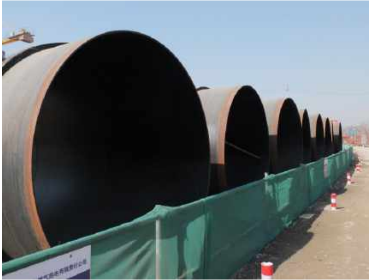
北京东北热电中心京能燃气热电厂循环水管外壁防腐 Circulating water pipe exterior anticorrosion of Beijing East North thermal power center