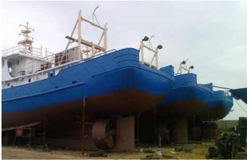
荣昌渔业有限公司出口到南非的25条渔船 25 fish boat of Rongchang fisheries Co.,Ltd export to South Africa