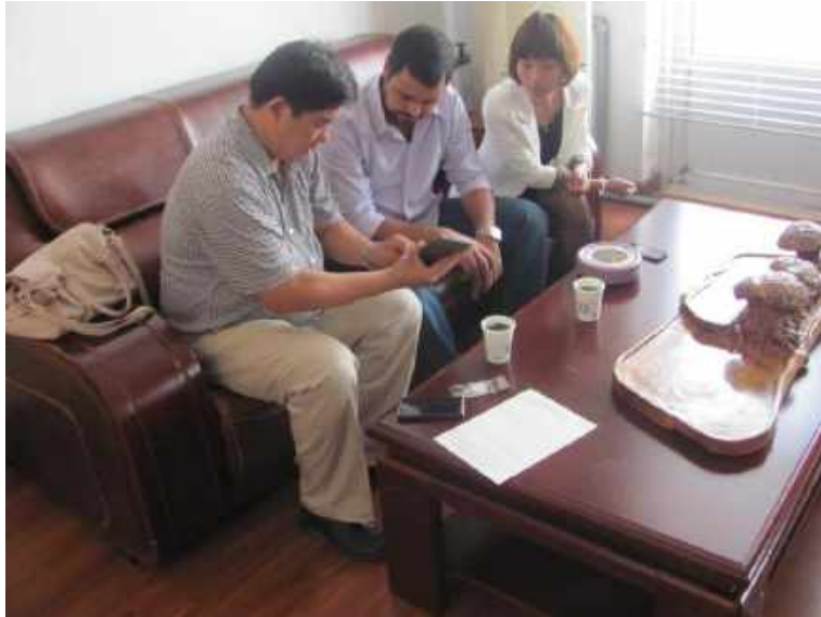
黎巴嫩合作三年客户来公司考察 Lebanon customers cooperated for three years visit our company