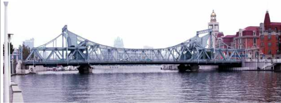
天津解放桥钢结构防腐 Steel structure anticorrosion of Tianjin Jiefang Bridge