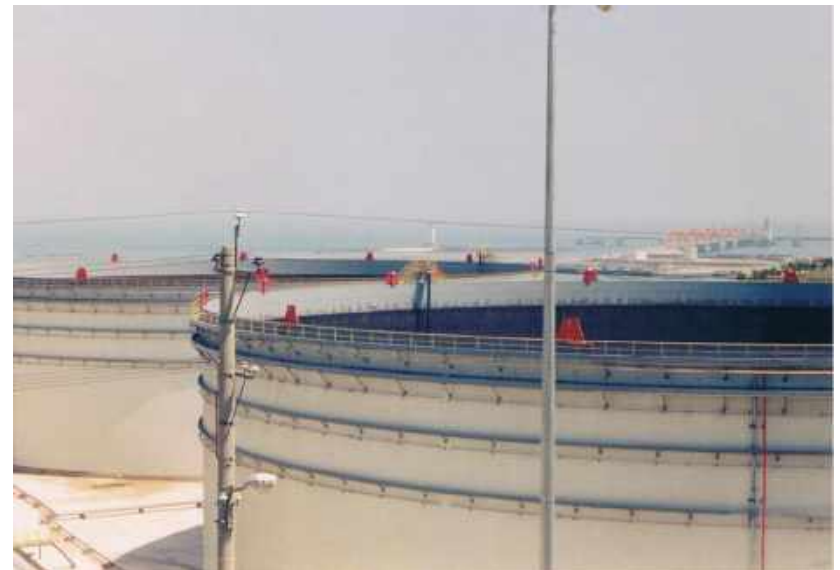
大连港务局6台10万立方原油储罐防腐 6 sets of 100,000 cubic crude oil storage tank anticorrosion of Dalian Port Authority