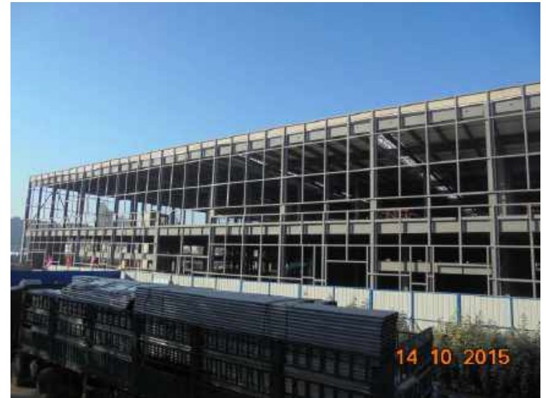
一汽大众长春工厂一厂结构更新项目 STEEL STRUCTURE RENEW PROJECT OF FAW-VOLKSWAGEN PLANT