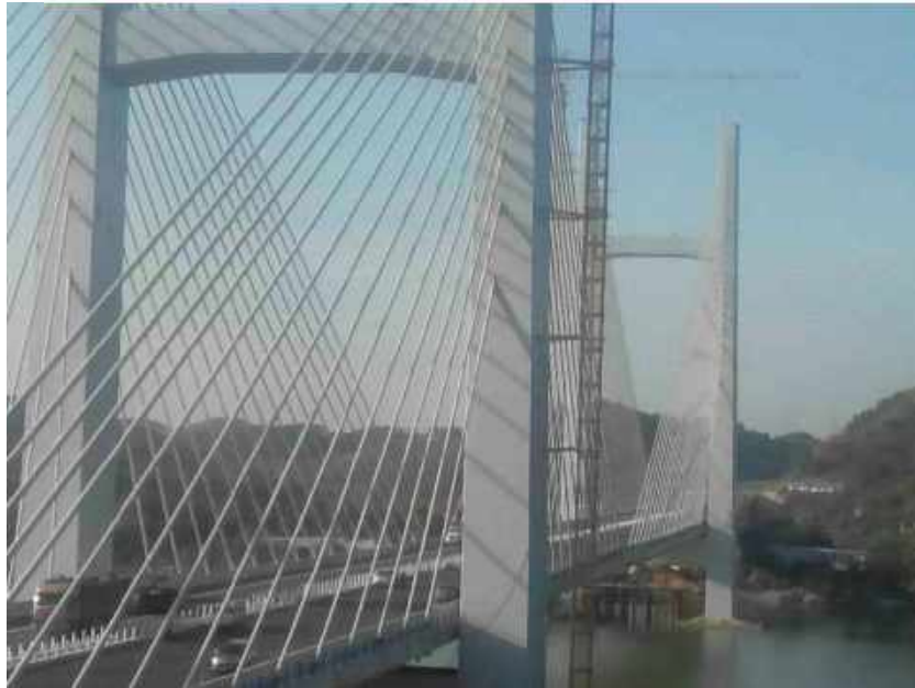
广西邕江特大桥防腐 Guangxi Yongjiang bridge anti-corrosion