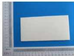
Photo of the Submitted Sample

Test Report No. C181010049001 Date: Oct 22, 2018 Page 2 of 3