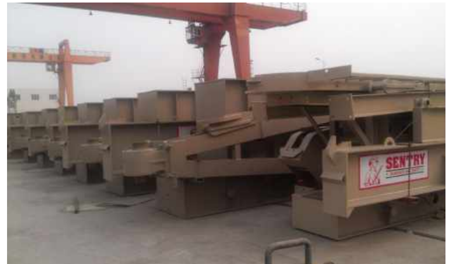
山东捷科采油设备有限公司出口 美国抽油机防腐 Anticorrosion of oil pumping equipment exported to America by Shandong Jieke Oil Equipment Co., Ltd