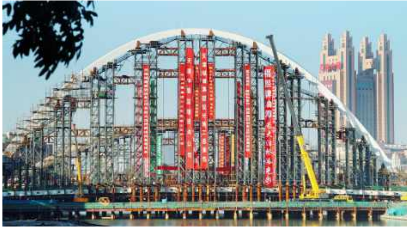
天津大沽桥 4300 吨钢结构防腐 4300 tons steel structure anticorrosion of Tianjin Dagu Bridge