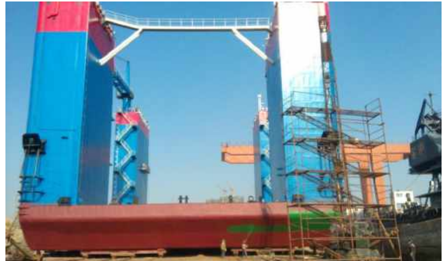
中国建筑奔腾诚基工7号工程船防腐 China Building Pentium Base No. 7 working ship