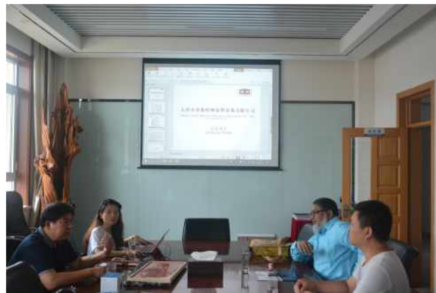
孟加拉国亚客户考察 Bangladesh Customer Visiting